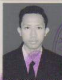
SMK BINA WARGA 1 BOGOR